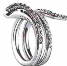
In oro bianco e diamanti Damiani.