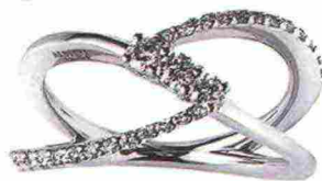
In oro bianco con brillanti Alfieri & St. John.