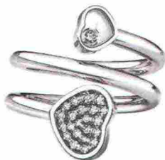
Con pavé di brillanti e solitario mobile Chopard.